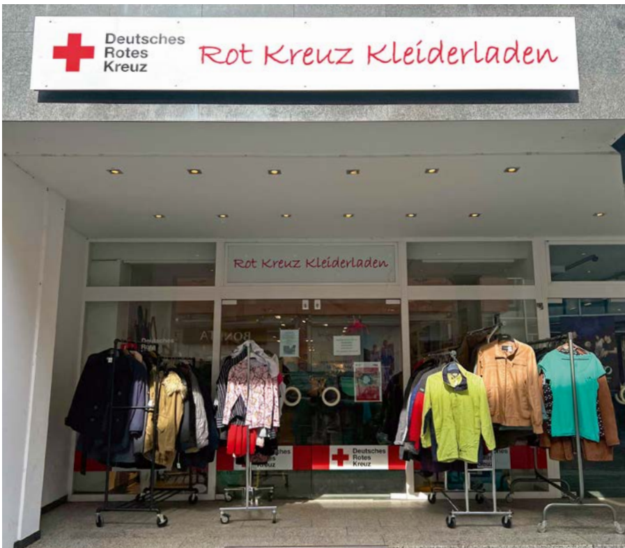
Kleiderladen DRK Kreisverband Grevenbroich e. V.