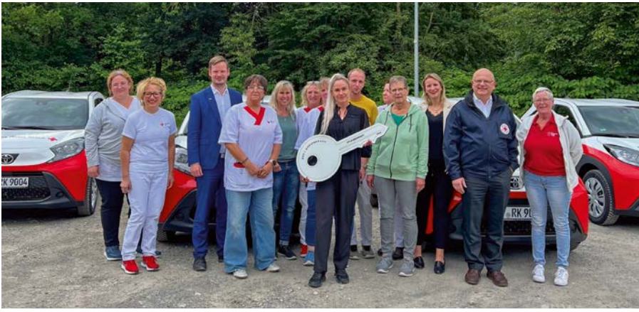
Übergabe der neuen Autos an das ambulante Pflegeteam