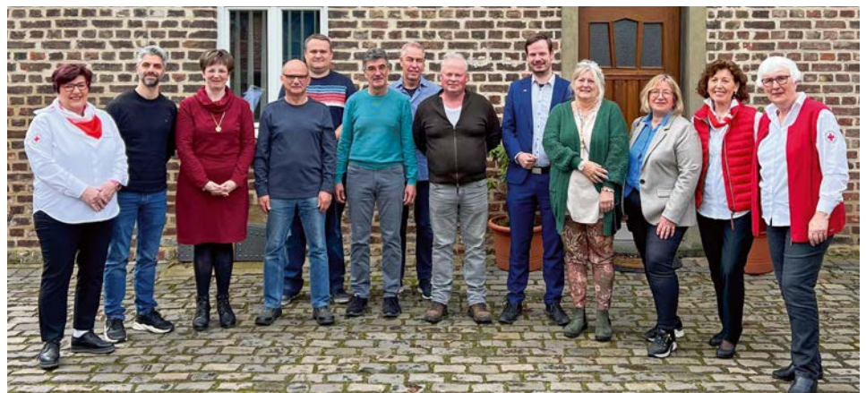
Blutspenderehrung in Rommerskirchen/Sinstedden

Der DRK Ortsverein Rommerskirchen weiß dieses Engagement sehr zu schätzen und zeichnete die Blutspender in der Trattoria 29 im Stadtteilkulturzentrum Sinstedden mit einer Urkunde aus. Sieben treue